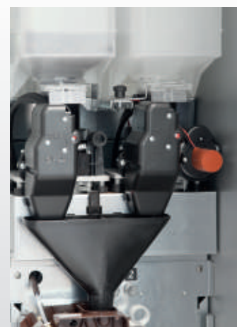
Regolazione automatica della macinatura su caffè top