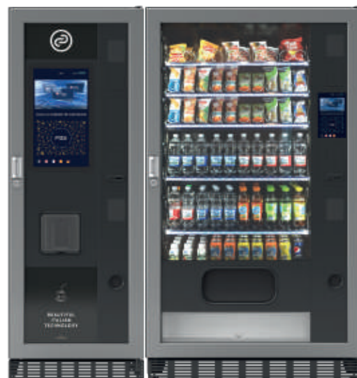
Fas Vicotira + Fas 1050 Pro