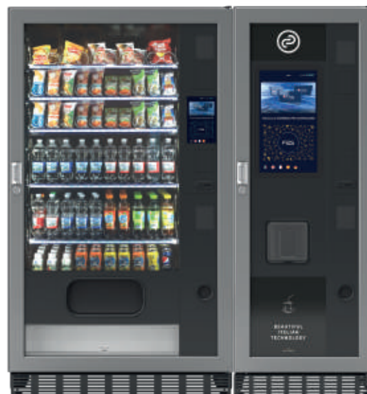
Fas 1050 PRO