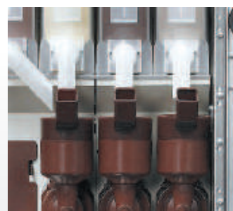
Mixer Fas ad alta resa con sistema auto aspirante