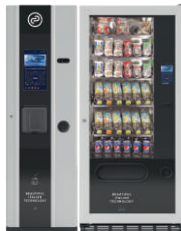
FAS Mia + Fas 750 Business