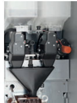
Regolazione automatica della macinatura su caffè top