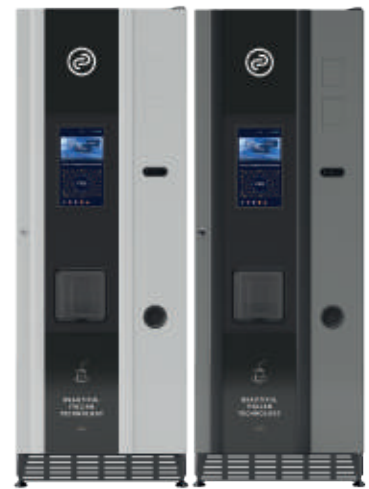
Fas Lydia + Fas Lydia Grafite